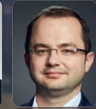
Ch. MÜHL NOVARTIS PHARMA GmbH