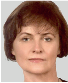
Hildegard Bäumler-Hösl Oberstaatsanwältin bei der Staatsanwaltschaft München Hauptabteilungsleiterin bei der Staatsanwaltschaft München I